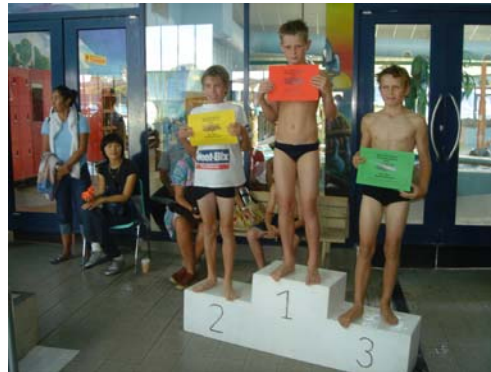
Des élèves de Ropu 5, dans l'équipe de natation de l'école. Félicitations!

Ruma 12, D'après "Un jour la troupe' campa" Mars 2005